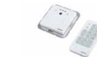
611450 liniLED® Wandpaneel