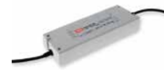
611307 Voeding 30 W 24 V DC IP64 611315 Voeding 60 W 24 V DC IP64 611321 Voeding 100 W 24 V DC IP64