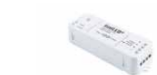
611100 Basic Controller 120 W