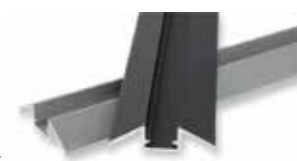
610982 Lijnprofiel 20 mm Wit [1 m] 610959 Acrylaat 20 mm Diffuus [1 m] 610969 Eindkap 20 mm