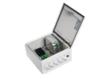
611853 RGB/Dimkast 120 W IP66 611854 RGB/Dimkast 240 W IP66 611855 RGB/Dimkast 480 W IP66