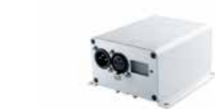
611121 RGB/Dim Controller DMX 240 W 611122 Dim Controller 0-10 V 240 W 611123 Dim Controller 1-10 V 240 W