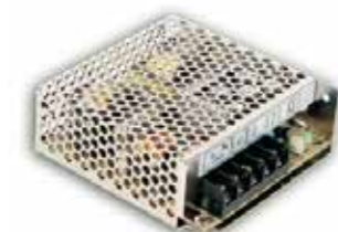
611305 Voeding 25 W 24 V DC 611310 Voeding 50 W 24 V DC 611317 Voeding 75 W 24 V DC 611320 Voeding 100 W 24 V DC 611326 Voeding 150 W 24 V DC 611331 Voeding 200 W 24 V DC 611335 Voeding 320 W 24 V DC 611339 Voeding 500 W 24 V DC