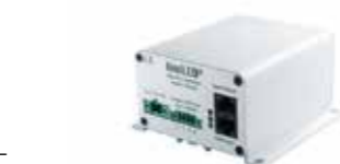
611120 RGB/Dim Controller 240 W