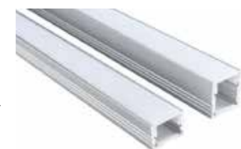
610985 Lijnprofiel 40 mm Wit [1 m] 610961 Acrylaat 40 mm Wit [1 m] 610971 Eindkap 40 mm