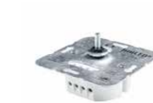
611458 Dimmer 110 W 611459 Digitale Dimmer 110 W