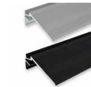
611565 Traptredeprofiel Zilver [1 m] 611567 Traptredeprofiel Zwart [1 m]