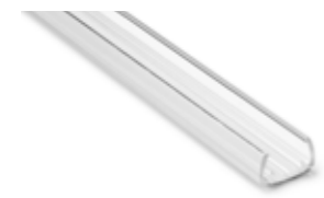
611369 liniLED® U-Profil met dubbelzijdig tape [1 m]