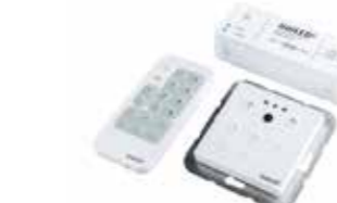
611101 liniLED® Control Set 120 W