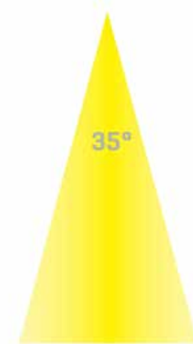
XPG met lens

De 180 Lumen wordt bereikt met een vermogen van slechts 2,3 Watt, hiermee is de Lumen/Watt verhouding ruim 78 Lm/W.