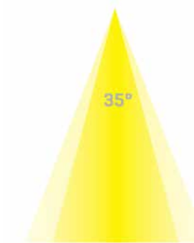
COB met reflector